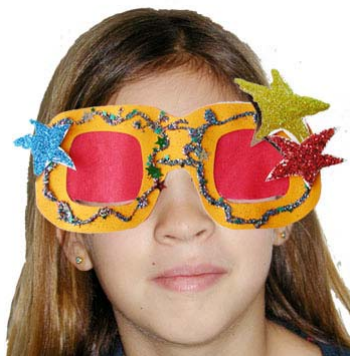
Les lunettes de star