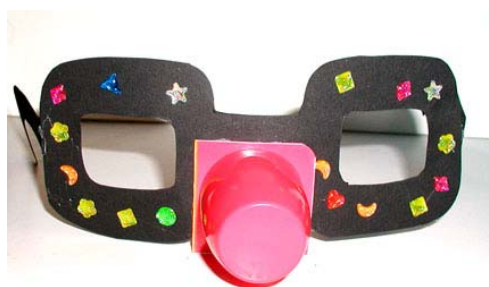
Les lunettes de clown